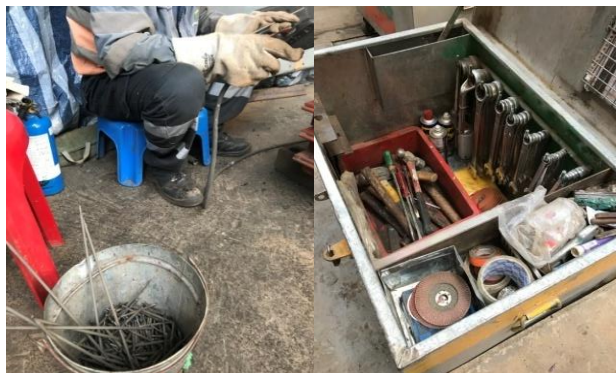
Tools / parts stored in containers 工具及物料放置在容器中