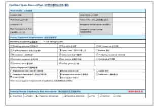
Confined Space Rescue Plan 拯救計劃