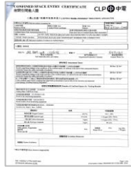
Confined Space Entry Certificate 密閉空間進入證