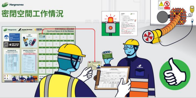
Double-Card System 雙卡制進出管制