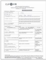
Confined Space Risk Assessment Report 密閉空間風險評估