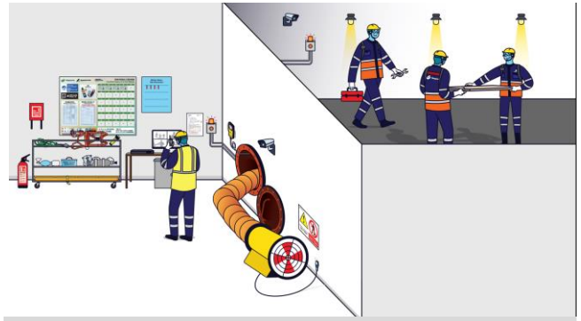
CCTV Monitoring and Recording System 實時影像監測及記錄系統